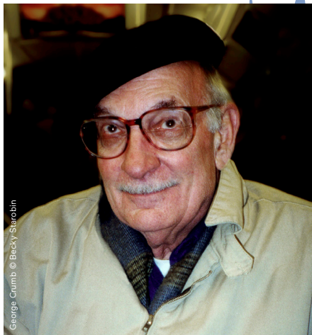
George Crumb